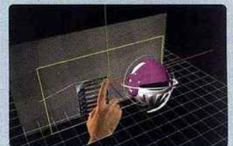
Conçu par des professionnels, 3D-TRICKS permet de pallier à la carence en outils dédiés à la production de contenus.

Avec 3D-TRICKS, les réalisateurs de films 3D vont enfin pouvoir travailler avec un outil spécifiquement pensé et conçu pour le montage et la post-production de films en relief, avec ou sans lunettes. Développé par la société 3DTV Solutions, spécialiste des technologies de l'image 3D-Relief, 3D-TRICKS est le premier outil de montage et de post-production spécifiquement dédié au relief. Il permet, à partir de médias d'origines et de formats divers (2D, 3D, relief), de réaliser un film complet et de l'exporter en vue d'une exploitation directe sur l'écran relief de son choix. Pour plus d'informations : www.3dtsolutions.com □TD