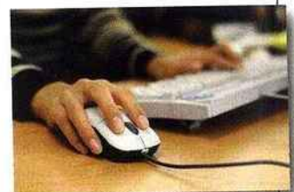
Paiement des contenus et des informations sur Internet : les Français restent les mauvais élèves de la classe mondiale.

de leurs usages de la toile. Reste que la France est dans le peloton de tête des pays tirant un bilan très positif d'Internet dans son influence sur la société. C'est déjà ça ! □TD