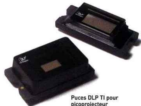
Puces DLP TI pour picoprojecteur